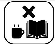
KEIN GETRÄNKE UND MAGAZINSERVICE

Leider dürfen wir unseren Gästen vorläufig keine Getränke und Zeitschriften anbieten.